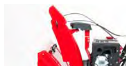
Прочный стальной желоб выброса