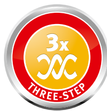
3-х ступенчатая система уборки снега

загребного ковша, с более широкой кромкой сверху, обеспечивает лучший сбор снега. С помощью опорных лыж можно менять рабочую высоту машины в зависимости от типа и рельефа очищаемой от снега поверхности.