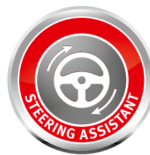
Легкое управление машиной