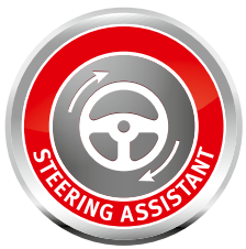
Легкое управление машиной (модель SF 66 E)