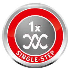
1-ступенчатая система уборки снега

Шнек тянет машину вперед и загребает снег, отправляя его в ковш, откуда он выбрасывается через желоб. Благодаря резиновому покрытию шнека обеспечивается защита как дорожного покрытия от царапин, так и самого шнека.