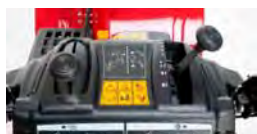
Интуитивно понятная панель управления