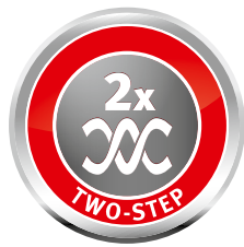
2-х ступенчатая система уборки снега

На первом этапе уборки зубчатые шнеки крошат снег, а на втором этапе он подается в желоб выброса с помощью крыльчатки. Скорость работы можно менять в зависимости от снежных условий.